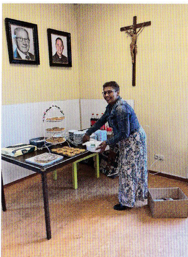
Een van onze vrijwilligers onder het toezien oog van vorige pastoors en Onze Lieve Heer.

Actie Kerkbalans nodigt u uit om een beetje van uw financiële middelen te delen met de gemeenschap van onze parochie St. Petrus' Stoel.