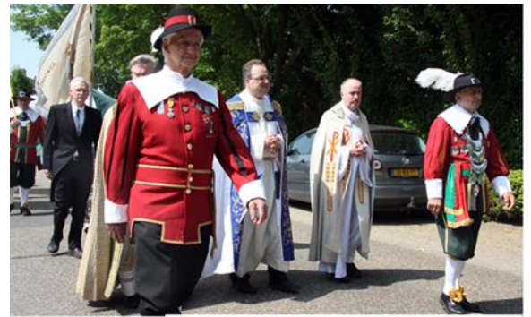
Tijdens de processie in Ommel