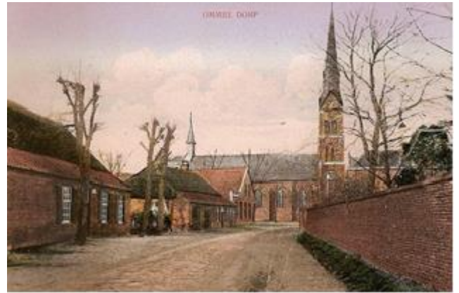
Ommel voor de oorlog